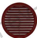
вариант в кафяво brown alternate